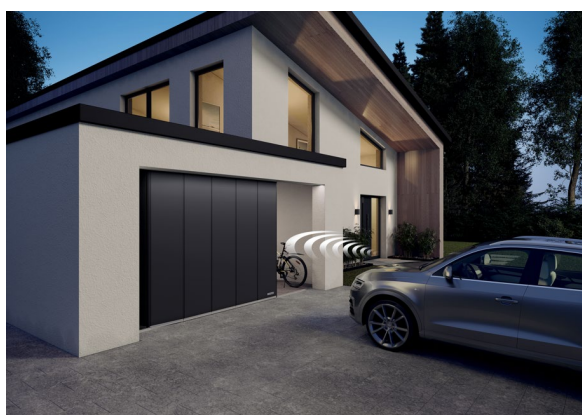
Brama segmentowa boczna HST