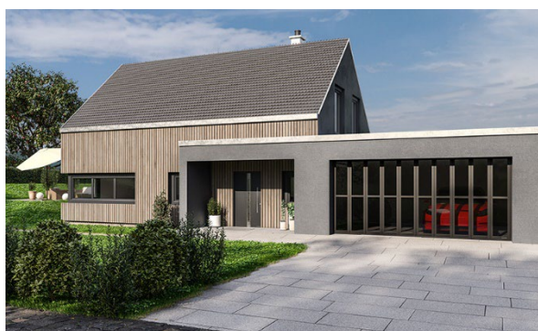
Brama segmentowa boczna HART z profili aluminiowych