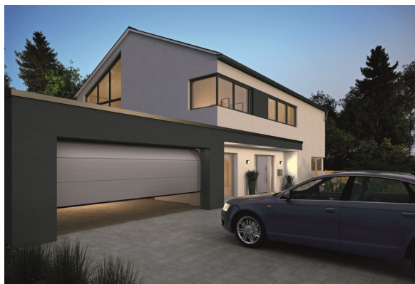
Garazowa brama segmentowa LPU 67 Thermo