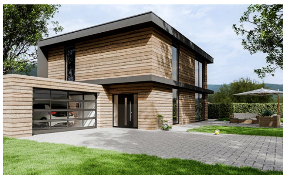
Brama segmentowa ART 42 z profili aluminiowych