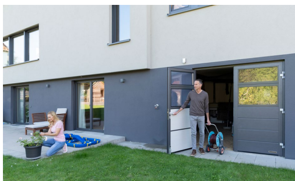
Brama garażowa 2-skrzydłowa DFT 42

Informacja prasowa oraz zdjęcia są dostępne pod linkiem: