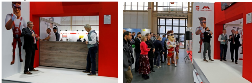
Fot. 8, 9

Odbywające się w ramach MONTERIADY pokazy fachowego montażu bramy garażowej i drzwi wejściowych cieszyły się dużym zainteresowaniem zwiedzających.