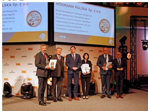
Prezes firmy Hörmann Polska sp. z o.o. wraz z dwójkiem przedstawicieli firmy odebrali aż pięć Złotych Medali MTP.