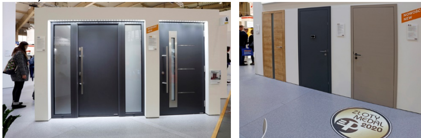
Fot. 3, 4

Złotymi Medalami MTP nagrodzono drzwi zewnętrzne ThermoPlan Hybrid, a także drzwi wewnętrzne Concepto DesignLine.