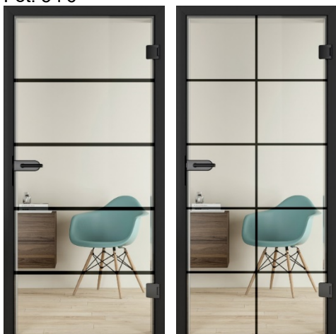
Fot. 5 i 6

Odpowiadając na zapotrzebowanie, jakie wiąże się modnym nowoczesnym wzornictwem industrialnym, firma Hörmann oferuje drzwi pełnoszkłane w stylu loftowym.