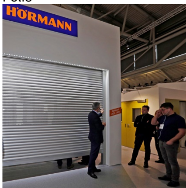
Premierę miał też tu nowy ShopRoller SR 65.