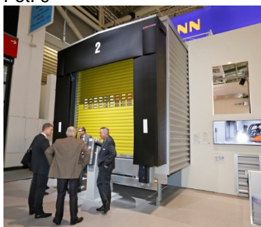
Nie zabrakło także innowacji z dziedziny techniki przeładunku.