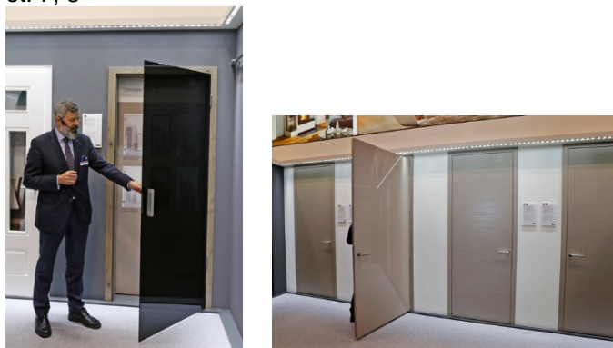
Firma pokazała także wiele nowych wzorów drewnianych drzwi wewnętrznych.