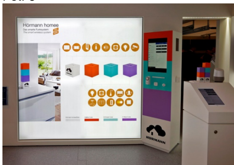
Hörmann na targach BAU 2019 zaprezentował własny system domu inteligentnego - Hörmann homee.