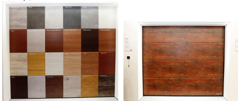
Fot. 2, 3

Bogata oferta bram z powierzchnią Duragrain daje szerokie możliwości aranżacji.