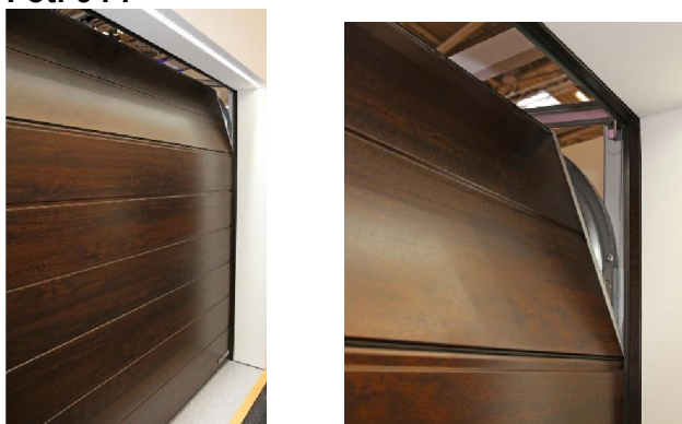
Fot. 6 i 7

Zaprezentowany na targach czujnik wilgotności umożliwia zaprogramowanie wentylowania garażu przy zamkniętej bramie.