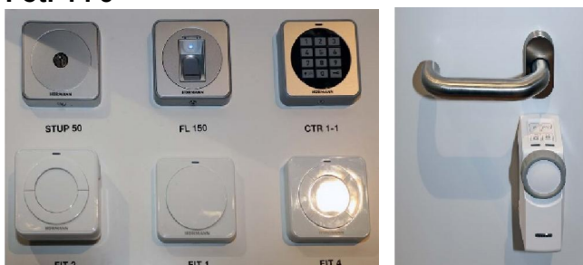
Fot. 4 i 5

Hörmann pokazał nową generację elementów obsługi, w tym automat kluczykowy.