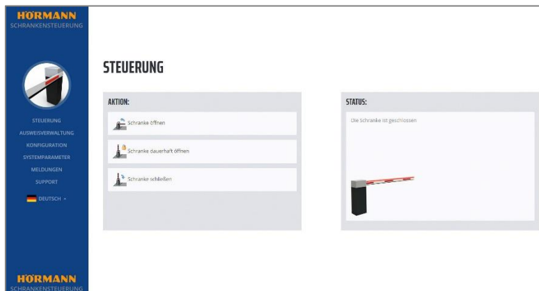
Bild 6: Mit der optionalen Anbindung über einen Web-Server können mehrere Schrankenanlagen zentral von einem Ort verwaltet werden. Zusätzlich ist eine Fernsteuerung und Statusabfrage möglich.