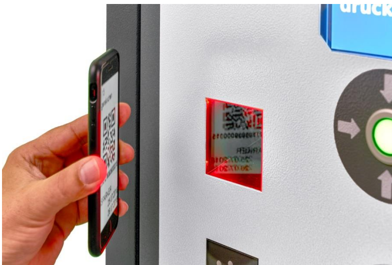
Bild 4: Bei modernen Lösungen können Schranken auch mit einem QR-Code auf dem Smartphone bedient werden. Dabei wird das Smartphone berührungslos vor den Leser am Kontrollgerät gehalten.

Bild 3: Der Fahrer kann sich durch Codeeingabe, Fingerabdruck, einen QR- beziehungsweise Barcode oder eine RFID-Transponderkarten legitimieren.