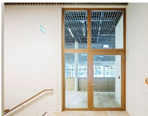
Transparence et fonctionnalité maximales en un

générations futures et poursuit l'objectif de réduire et d'éviter les émissions avec sa stratégie de protection climatique. Les émissions restantes sont compensées par la promotion de projets de protection climatique certifiés en coopération avec ClimatePartner. Vous trouverez ici de plus amples informations sur notre stratégie de durabilité : Sustainability – We think and act green | Hoermann