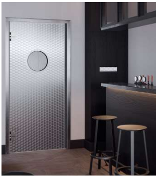
Edelstahl-Pendeltür für eine optisch hochwertige Türansicht