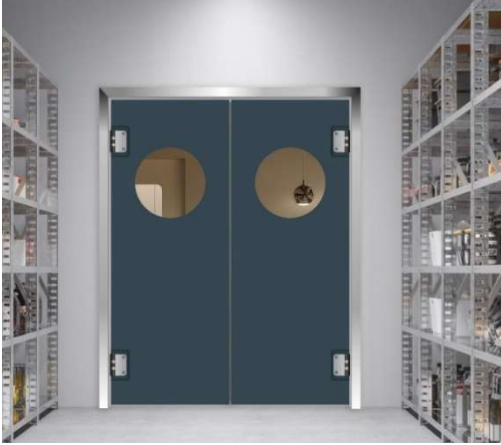
PE-Pendeltür – flexible Einsatzmöglichkeiten