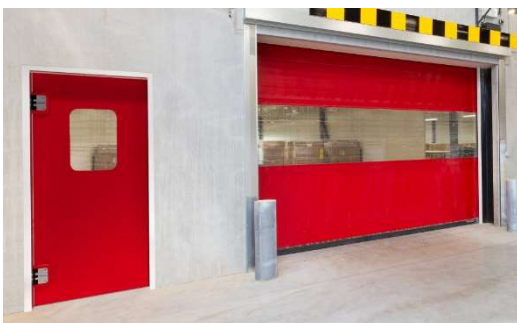
Schnellläufer V5030 in Kombination mit einer Pendeltür als Personendurchgang