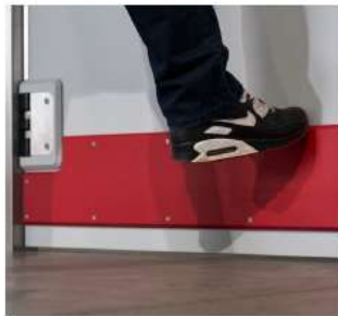
Der optional erhältliche Rammschutz schützt das Türblatt.