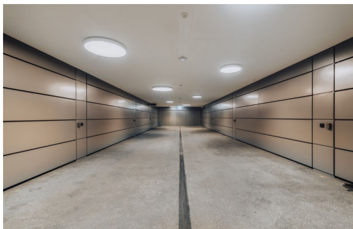
Les portes sectionnelles de garage ALR F42 de Hörmann affleurantes ferment élégamment les diffé- rents garages.

Les exigences et formulations ne se limitent pas à la façade du Seegüetli. L'intérieur a été conçu et réalisé individuellement pour chaque unité, conformément aux besoins et sou- haits. Tout en privilégiant la fonctionnalité, les solutions design ont été intégrées avec co- hérence. Cette approche commence par des entrées généreuses, des aménagements de qualité, jusqu'aux portes de garage industrielles affleurantes.