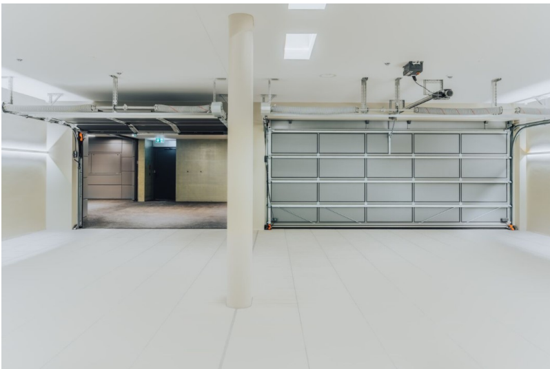
Innenansicht der grossen Einzelgaragen | Foto: marty architektur AG

Telefon 062 388 69 23 E-Mail marketing.oen@hoermann.ch