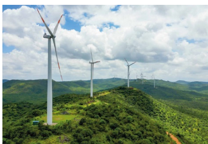
Projet d'énergie éolienne en Inde

Téléphone 062 388 69 23 E-Mailmarke- ting.oen@hoermann.ch