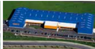
Hörmann Flexon LLC, Burgettstown PA, USA