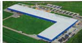
Hörmann Legnica Sp. z o.o., Polen