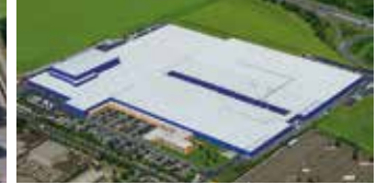
Hörmann KG Ichtershausen, Deutschland