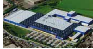
Hörmann KG Brandis, Deutschland