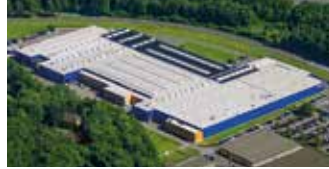
Hörmann KG Eckelhausen, Deutschland