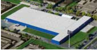
Hörmann KG Dissen, Deutschland