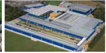
Hörmann KG Brockhagen, Deutschland