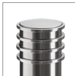
Udførelse med 4-x cirkelring (kun i udførelsen rustfrit stål)