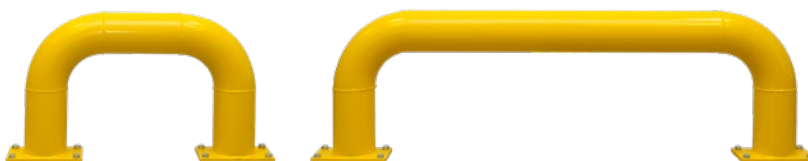
Påkørsels bøjle kort Påkørsels bøjle lang