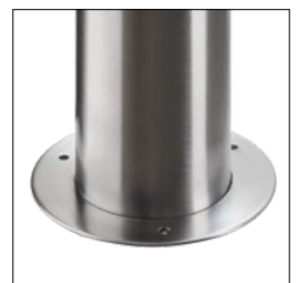
Udførelse med skrueflange til fastgørelse med skruer