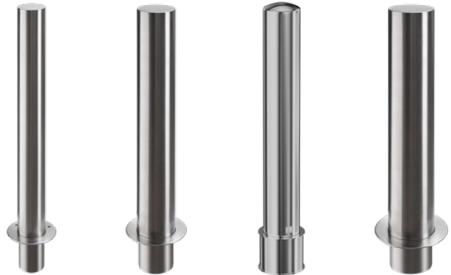
Billedet viser udførelsen med bundmontering i beton