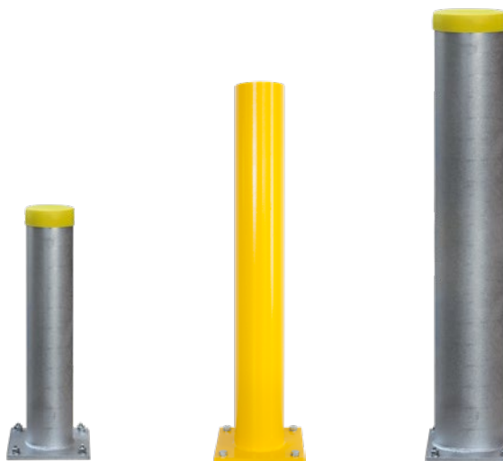
Påkørsels søjle Påkørsels søjle Påkørsels søjle