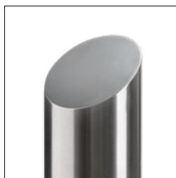
Udførelse med affaset dæksel