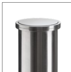
Udførelse med bred cirkelring (kun i udførelsen rustfrit stål)