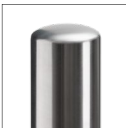
Udførelse med hvælvet dæksel

**Leveres også med 102 mm og 168 mm på forespørgsel