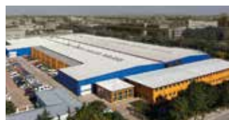
Hörmann Beijing, Chiny