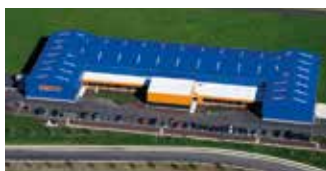
Hörmann Flexon LLC, Burgettstown PA, USA