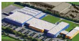
Hörmann KG Antriebstechnik, Niemcy