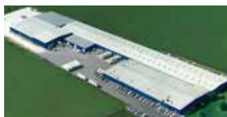
Hörmann LLC, Montgomery IL, USA