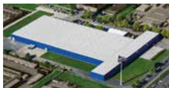
Hörmann KG Dissen, Niemcy