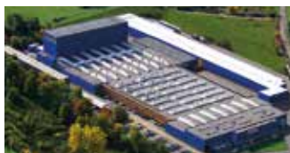
Hörmann KG Freisen, Niemcy