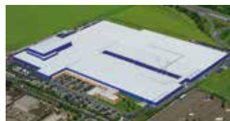
Hörmann KG Ichttershausen, Niemcy