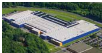
Hörmann KG Eckelhausen, Niemcy