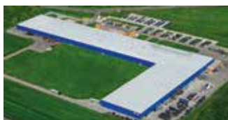
Hörmann Legnica Sp. z o.o., Polska