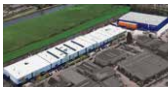
Hörmann Alkmaar B.V., Holandia