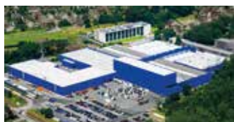
Hörmann KG Amshausen, Niemcy