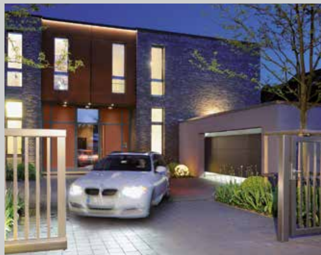
Bramy garażowe i napędy do bram

Bogata oferta ościeżnic do nowych, adaptowanych bądź modernizowanych budynków.