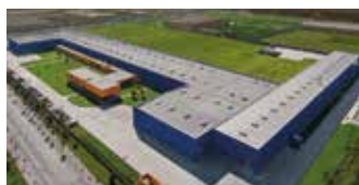
Hörmann Tianjin, Chiny