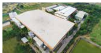
Shakti Hörmann Pvt. Ltd., Indie

Grupa Hörmann oferuje wszystkie elementy stolarki budowlanej z jednej ręki – jako jedyny producent na międzynarodowym rynku. Produkowane są one w wysoko wyspecjalizowanych zakładach, zgodnie z najnowszymi osiągnięciami techniki. Rozbudowana sieć dystrybucji i serwisu w Europie oraz obecność firmy w Ameryce i Azji sprawia, że Hörmann jest solidnym partnerem w zakresie stolarki budowlanej, której jakość nie dopuszcza żadnych kompromisów.