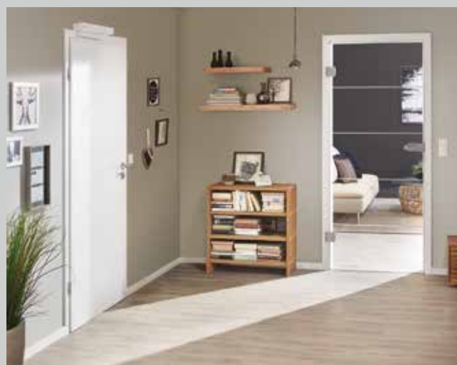
Drzwi pokojowe i napędy do drzwi