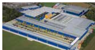
Hörmann KG Brockhagen, Niemcy