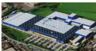
Hörmann KG Brandis, Niemcy