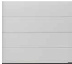
34 White brushed