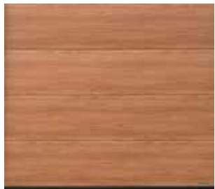
22 Noce sorrento natur