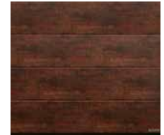
12 Rusty Steel