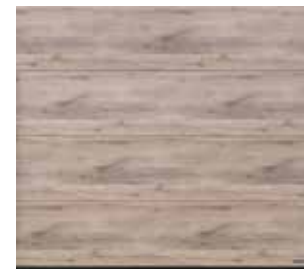
36 Whiteoiled Oak