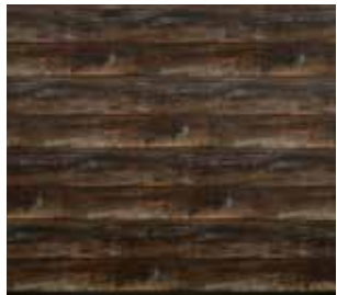
14 Burned Oak