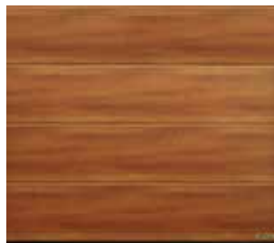
33 Walnuss Kolonial