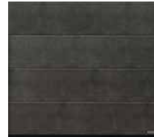
10 Grigio scuro