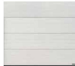
35 White Oak