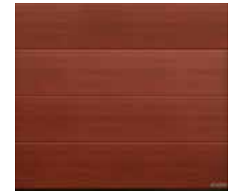
21 Rusty Oak