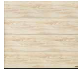
28 Used Look