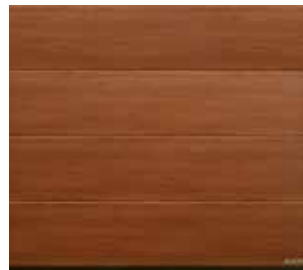
26 Noce sorrento balsamico