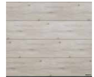
38 Whitewashed Oak