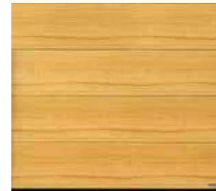
20 Nature Oak