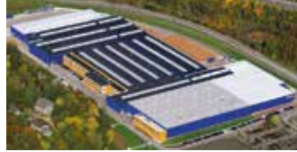
Hörmann KG Eckelhausen, Deutschland