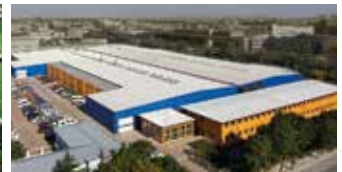
Hörmann Beijing, China