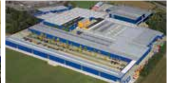
Hörmann KG Brockhagen, Deutschland