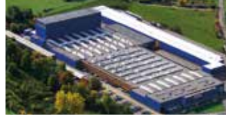
Hörmann KG Freisen, Deutschland