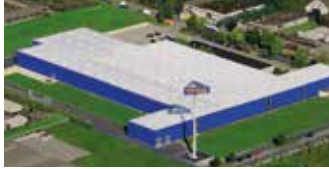
Hörmann KG Dissen, Deutschland