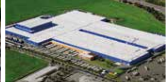
Hörmann KG Ichtershausen, Deutschland