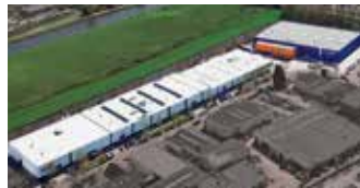
Hörmann Alkmaar B.V., Niederlande