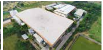
Shakti Hörmann Ltd., Indien

Als einziger Hersteller auf dem internationalen Markt bietet die Hörmann Gruppe alle wichtigen Bauelemente aus einer Hand. Sie werden in hochspezialisierten Werken nach dem neuesten Stand der Technik gefertigt. Durch das flächendeckende Vertriebs- und Servicenetz in Europa und die Präsenz in Amerika und Asien ist Hörmann Ihr starker, internationaler Partner für hochwertige Bauelemente. In einer Qualität ohne Kompromisse.