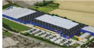
Hörmann KG Brandis, Deutschland