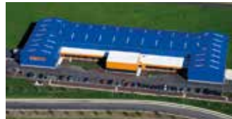
Hörmann Flexon LLC, Burgettstown PA, USA