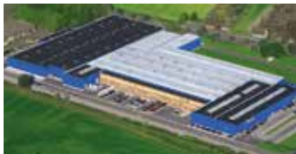
Hörmann KG Werne, Deutschland