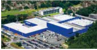
Hörmann KG Amshausen, Deutschland