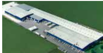
Hörmann LLC, Montgomery IL, USA