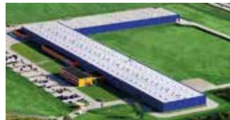
Hörmann Legnica Sp. z o.o., Polen