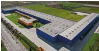
Hörmann Tianjin, China