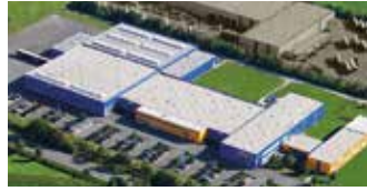
Hörmann KG Antriebstechnik, Deutschland