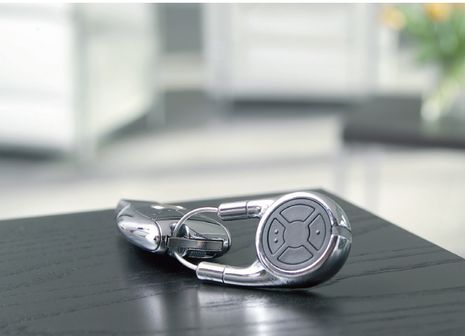
Nagrađen: model HSD 2 od Hörmann-a dobio je poznatu nagradu Red dot za svoje veoma kvalitetno kućište od aluminijuma ili od hromiranog čelika visokog sjaja.

Udarnih desetina 32 11271 Beograd-Surčin Tel: +381 11 8440 821 Mob: +381 62 760 126 b.simovic@hormann.rs www.hormann.rs