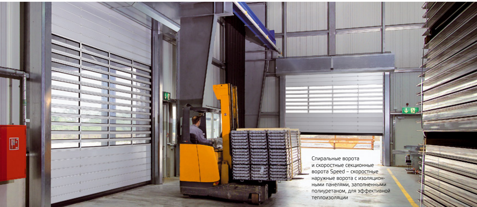
Спиральные ворота и скоростные секционные ворота Speed – скоростные наружные ворота с изоляционными панелями, заполненными полиуретаном, для эффективной теплоизоляции

В складских, производственных и других помещениях коммерческой недвижимости очень важно обеспечить бесперебойную работу, комфортный температурный режим и соблюдение правил техники безопасности. Также все большее значение приобретает привлекательный дизайн ворот. Поэтому при разработке новых решений Hörmann в области промышленных ворот во главу угла ставились энергоэффективность, оптимизация процессов, долговечность и привлекательный дизайн.